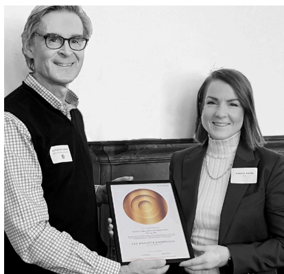
K2A Knaust & Andersson